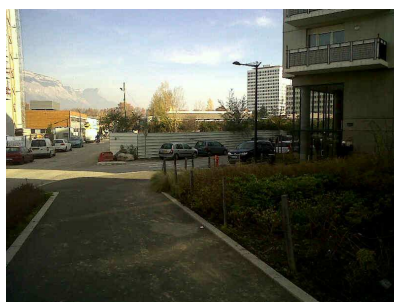
Aménagement de nouveaux espaces publics Ilot P et Chauvin